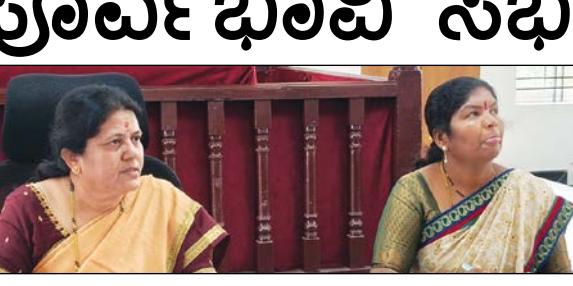
ಕೋಲಾರ: ಜಿಲ್ಲೆಯಲ್ಲಿ ಇದೇ 12 ರಂದು ಶ್ರೀ ರೇಣುಕಾಚಾರ್ಯ ಜಯಂತಿ, 14 ರಂದು ಶ್ರೀ ಯೋಗಿನಾರಾಯಣ ಯತಿಂದ್ರರ ಜಯಂತಿ, 28 ರಂದು ಅಗ್ನಿನಿರಾಯ ಜಯಂತಿಗಳ ಕುರಿತು ಅಪಾರ ಜಿಲ್ಲಾಧಿಕಾರಿ ಮಂಗಳ ಮತ್ತು ಕನ್ನಡ ಮತ್ತು ಸಂಸ್ಕೃತಿ ಇಲಾಖೆಯ ನೇತೃತ್ವದಲ್ಲಿ ಸಮುದಾಯದ ಮುಖಂಡರ ಜೊತೆ ಪೂರ್ವಭಾವಿ ಸಭೆಯನ್ನು ನಡೆಸಿದರು. ಅತರ ಜಿಲ್ಲಾಧಿಕಾರಿ ಮಂಗಳ ಮಾತನಾಡಿ, ಇದೇ ತಿಂಗಳು 12 ನೇ ಬುದ್ಧವಾರದಂದು ಶ್ರೀ ರೇಣುಕಾಚಾರ್ಯ ಜಯಂತಿಯನ್ನು ನಗರದ ಟಿ. ಚನ್ನಯ್ಯ ರಂಗಮಂದಿರದಲ್ಲಿ ಆಚರಿಸಲು ಸರ್ಕಾರ ನಿರ್ಧರಿಸಿರುವುದಾಗಿ ತಿಳಿಸಿದರು. ಸಮುದಾಯದ ಮುಖಂಡರು ಮಾತನಾಡಿ, ನಮ್ಮ ಸಮುದಾಯದ ಸ್ವಾಮೀಜಿ ಅವರ ಕಾರ್ಯಕ್ರಮದಲ್ಲಿ ಪಾಲ್ಗೊಳ್ಳಲಿದ್ದಾರೆ ಮತ್ತು ನಗರದ ಬಸವೇಶ್ವರ ದೇವಾಲಯ ಆವರಣದಿಂದ ಸ್ವಲ್ಪಚಿತ್ರ ಚಿತ್ರಗಳೊಂದಿಗೆ ಮೆರವಣಿಗೆ ನಡೆಸಿ ನಂತರ ವೇದಿಕೆ ಕಾರ್ಯಕ್ರಮದಲ್ಲಿ ಭಾಗಿಯಾಗುವುದಾಗಿ ತಿಳಿಸಿದರು. ಶ್ರೀ ಯೋಗಿನಾರಾಯಣ ಯತಿಂದ್ರರ ಜಯಂತಿ ಆಚರಣೆ ಇದೇ 14 ರಂದು ಮಾಡಲಾಗುವುದು, ಟೀಕಲ್ ಸರ್ಕಲ್‌ನಲ್ಲಿರುವ ಶ್ರೀ ಯೋಗಿನಾರಾಯಣ ಯತಿಂದ್ರರ ಪುತ್ಥಳಿಗೆ ಮಾಲಾರ್ಪಣೆ ಮಾಡಿ ವಿಶೇಷ ಪೂಜೆ ಸಲ್ಲಿಸಿ ಪ್ರಮುಖ ರಸ್ತೆಗಳಲ್ಲಿ ಮೆರವಣಿಗೆಯನ್ನು ನಡೆಸಿ ನಂತರ ಮಧ್ಯಾಹ್ನ 1.30 ಗಂಟೆಗೆ ಟಿ. ಚನ್ನಯ್ಯ ರಂಗಮಂದಿರದಲ್ಲಿ ವೇದಿಕೆ ಕಾರ್ಯಕ್ರಮ ನಡೆಯಲಿದೆ. ಅಗ್ನಿ ಬನಿಯಾಯ ಜಯಂತಿಯನ್ನು ಇದೇ 28 ರಂದು ಚನ್ನಯ್ಯ ರಂಗಮಂದಿರದಲ್ಲಿ ಆಚರಿಸಲಾಗುವುದು. ಸಭೆಯಲ್ಲಿ ಕನ್ನಡ ಮತ್ತು ಸಂಸ್ಕೃತಿ ಇಲಾಖೆಯ ಸಹಾಯಕ ನಿರ್ದೇಶಕ ವಿಜಯಲಕ್ಷ್ಮಿ ಸೇರಿದಂತೆ ಸಮುದಾಯದ ಮುಖಂಡರುಗಳು ಇದ್ದರು.