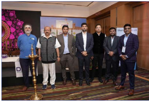
ಈ ಕಾರ್ಯಕ್ರಮವು 25 ಗಿಗಾ ವ್ಯಾಟ್ ಗಿಂತಲೂ ಹೆಚ್ಚು ಸಾಮರ್ಥ್ಯ ಹೊಂದಿರುವ ಕರ್ನಾಟಕವನ್ನು

ಬೆಂಗಳೂರು: ಈ ಕ್ಯಾನ್ಸರ್ ಮ್ಯಾನ್ಯುಯಲ್ ಸಂಸ್ಥೆಯು ಬೆಂಗಳೂರಿನ ದಿ ಲಲಿತ್ ಅಕಾಡೆಮಿ ಹೋಟೆಲ್ ನಲ್ಲಿ ಆಯೋಜಿಸಿದ್ದ ಬಹುನಿರೀಕ್ಷಿತ ಸೂರ್ಯಕಾನ್ ಬೆಂಗಳೂರು 2025 ಕಾರ್ಯಕ್ರಮದ ಅದ್ವೈತ ಜಾಲನೆ ನಡೆದಿದೆ. ಈ ಕಾರ್ಯಕ್ರಮದಲ್ಲಿ ಕರ್ನಾಟಕದ ಸೌರ ಶಕ್ತಿ ಕ್ಷೇತ್ರದ ಭವಿಷ್ಯವನ್ನು ರೂಪಿಸುವ ನಿಟ್ಟಿನಲ್ಲಿ ಉದ್ಯಮದ ಮುಖಂಡರು, ನೀತಿ ನಿರೂಪಕರು ಮತ್ತು ಸಂಶೋಧಕರು ಮಹತ್ವದ ಸಂವಾದವನ್ನು ನಡೆಸಿದರು. ಕಾರ್ಯಕ್ರಮದಲ್ಲಿ ಚರ್ಚಾ ಗೋಷ್ಠಿಗಳು, ತಂತ್ರಜ್ಞಾನ ಪ್ರದರ್ಶನಗಳು, ನೆಟ್ ವರ್ಕ್ ಸೆಷನ್ ಗಳು ನಡೆದವು. ಜೊತೆಗೆ ಪ್ರತಿಷ್ಠಿತ ಕರ್ನಾಟಕ ವಾರ್ಷಿಕ ಸೋಲಾರ ಪ್ರಶಸ್ತಿಗಳನ್ನು ಪ್ರದಾನ ಮಾಡಲಾಯಿತು.