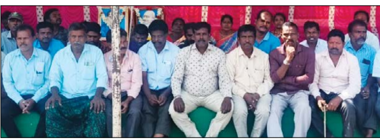
ಕೊಟ್ಟಿದ್ದರಿಂದ ಸಾರ್ವಜನಿಕರ ಹಿತದೃಷ್ಟಿಯಿಂದ ಮೂರು ದಿನಗಳ ಅನಿರೀಕ್ಷಿಸಿ ಅವಧಿ ಮುಷ್ಕರವನ್ನು ತಾತ್ಕಾಲಿಕವಾಗಿ ಹಿಂದಿಕ್ಕಿದುದೇ ಎಂದು ತಿಳಿಸಿದ್ದಾರೆ. ಮುಂದಿನ ದಿನಗಳಲ್ಲಿ ನಮ್ಮ ಬೇಡಿಕೆಗಳನ್ನು ಈಡೇರಿಸದಿದ್ದರೆ ರಾಜ್ಯ ಮಟ್ಟದ ಅಧ್ಯಕ್ಷರು, ಪದಾಧಿಕಾರಿಗಳ ತೀರ್ಮಾನದ ಮೇರೆಗೆ ಮುಷ್ಕರವನ್ನು ಮತ್ತೆ ಹೇಳಲಾಗುತ್ತದೆ.

ಬಳ್ಳಾರಿ: ಹಲವಾರು ಬೇಡಿಕೆಗಳನ್ನು ಮುಂದಿಟ್ಟುಕೊಂಡು ಕಳೆದ ಮೂರು ದಿನಗಳಿಂದ ಜಿಲ್ಲಾಧಿಕಾರಿಗಳ ಕಚೇರಿ ಮುಂದೆ ಅನಿರೀಕ್ಷಿಸಿದ ಮುಷ್ಕರ ಕೈಗೊಂಡಿದ್ದ ನೀರು ಸರಬರಾಜುದಾರರು ಗುರುವಾರ ಮುಷ್ಕರವನ್ನು ತಾತ್ಕಾಲಿಕವಾಗಿ ಹಿಂದಕ್ಕೆ ಪಡೆದಿದ್ದಾರೆ. ನಗರ ಶಾಸಕರು, ಮಹಾಪೌರರು, ಜಿಲ್ಲಾಧಿಕಾರಿಗಳು ಹಾಗೂ ಆಯುಕ್ತರ ಮನವಿ ಮೇರೆಗೆ ನಗರ ನೀರು ಸರಬರಾಜು ನೌಕರರು ಈ ಮುಷ್ಕರವನ್ನು ಹಿಂದಿಕ್ಕಿದಿದ್ದಾರೆ ಎಂದು ತಿಳಿಸಿದರು. ಬಿಸಿಲಿನ ಶಾಪ ಹೆಚ್ಚಾಗಿರುವುದರಿಂದ ಸಾರ್ವಜನಿಕರಿಗೆ ನೀರಿನ ಸಮಸ್ಯೆಯಾಗುತ್ತದೆ. ನಿಮ್ಮ ಮುಷ್ಕರಕ್ಕೆ ಬೆಂಬಲ ಕೊಡುತ್ತೇವೆ. ನಿಮ್ಮ ಬೇಡಿಕೆಗಳನ್ನು ಈಡೇರಿಸದಿದ್ದರೆ ಸರ್ಕಾರದ ಮುಟ್ಟಿದಲ್ಲಿಯೂ ಸಹ ಬಗೆಹರಿಸುತ್ತೇವೆಂದು ಭರವಸೆಯನ್ನು ಕೊಟ್ಟಿದ್ದರಿಂದ ಸಾರ್ವಜನಿಕರ ಹಿತದೃಷ್ಟಿಯಿಂದ ಮೂರು ದಿನಗಳ ಅನಿರೀಕ್ಷಿಸಿ ಅವಧಿ ಮುಷ್ಕರವನ್ನು ತಾತ್ಕಾಲಿಕವಾಗಿ ಹಿಂದಿಕ್ಕಿದುದೇ ಎಂದು ತಿಳಿಸಿದ್ದಾರೆ. ಮುಂದಿನ ದಿನಗಳಲ್ಲಿ ನಮ್ಮ ಬೇಡಿಕೆಗಳನ್ನು ಈಡೇರಿಸದಿದ್ದರೆ ರಾಜ್ಯ ಮಟ್ಟದ ಅಧ್ಯಕ್ಷರು, ಪದಾಧಿಕಾರಿಗಳ ತೀರ್ಮಾನದ ಮೇರೆಗೆ ಮುಷ್ಕರವನ್ನು ಮತ್ತೆ ಹೇಳಲಾಗುತ್ತದೆ.